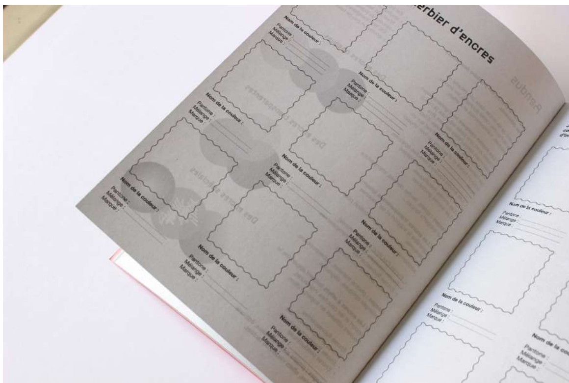
Vue des pages intérieures «Mon premier herbier d'encre»